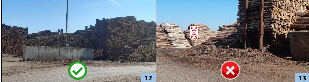
Abkehren in Richtung Mauer!